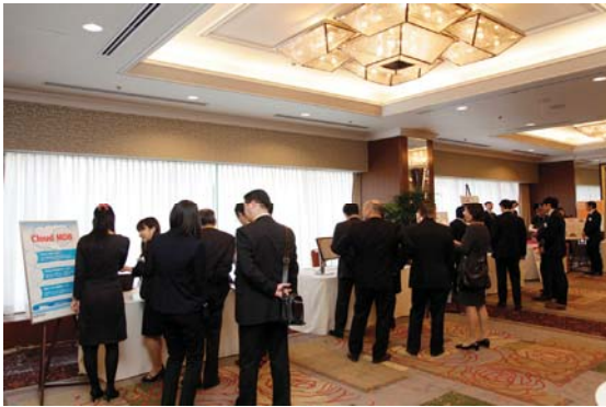
・弊社と docomo の共同展示ブースでは、大勢のお客様にお立ち寄りいただきました。